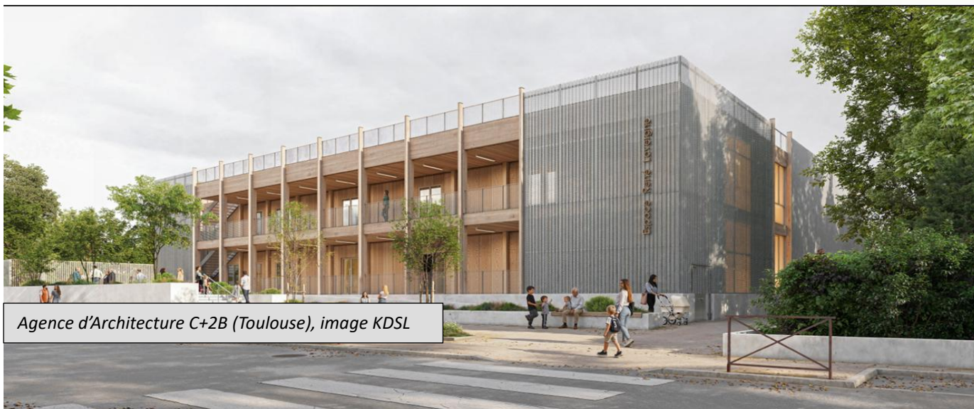
Agence d'Architecture C+2B (Toulouse)

Tous les Auzevillois ont pu constater que ce bâtiment est vétuste : il présente des problèmes de sécurité et un fort risque de fermeture administrative, car :